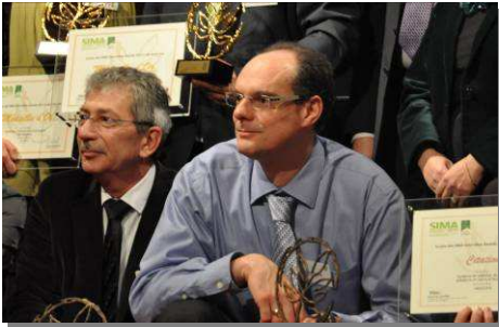
S. Roche